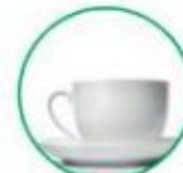
Oggetti in ceramica e porcellana