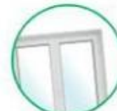
Vetri di finestre, finestrini di auto, vetri di fari e fanali