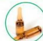
Confezioni in vetro dei farmaci usati