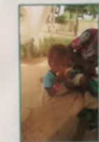
MAISON POUR LA VIE MAROUA - CAMERUN