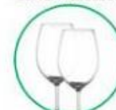
Oggetti in cristallo (bicchieri, lampadari, centrotavola, etc.)