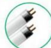
Tubi al neon