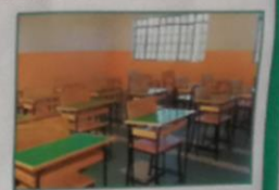
MISSIONE DI KING'EERO KENYA