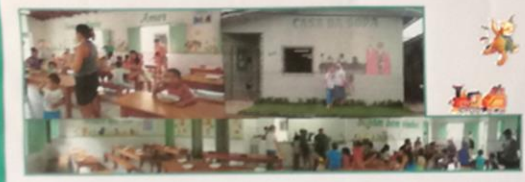
PROGETTO JADERLANDIA BRASILE

Nollaja Shona Dhaat a SHIBNOGOR in BANGLADESH abbiamo 20 bambini che hanno finito la scuola materna e, grazie anche a voi, quest'anno avranno la possibilità di iniziare la scuola elementare e di entrare nelle nuove aule che stiamo sostenendo.