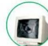
Tubi del televisore e schermi di tv, computer, monitor

abbiamo anche ragionato sugli errori da evitare quando dobbiamo differenziare i rifiuti in vetro perché non tutto ciò che sembra o assomiglia al vetro è riciclabile