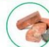
Pietre, sassi e inerti