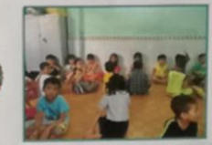
MISSIONE DI TRUONG PHO CAP VIETNAM