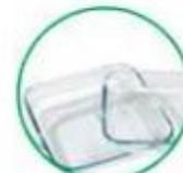
Contenitori in vetroceramica (pyrex, etc.)