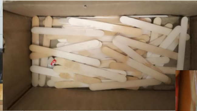
Palette di legno e bicchieri di carta

Ma i frequentatori più assidui si sono attrezzati ancora meglio!