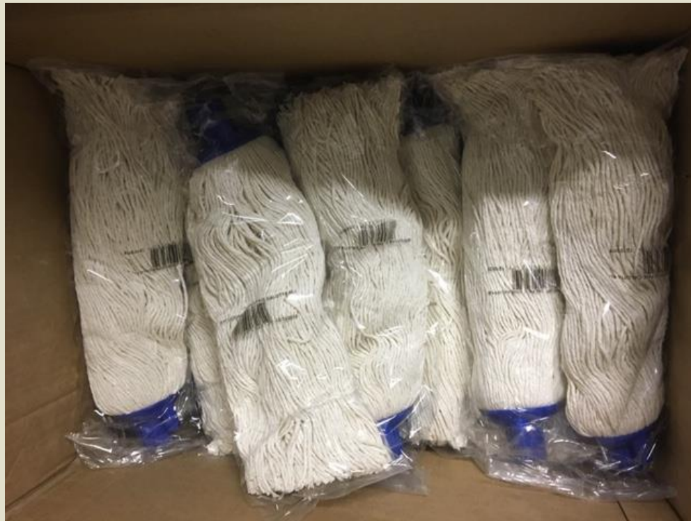
Mocio per pulire i pavimenti in cotone