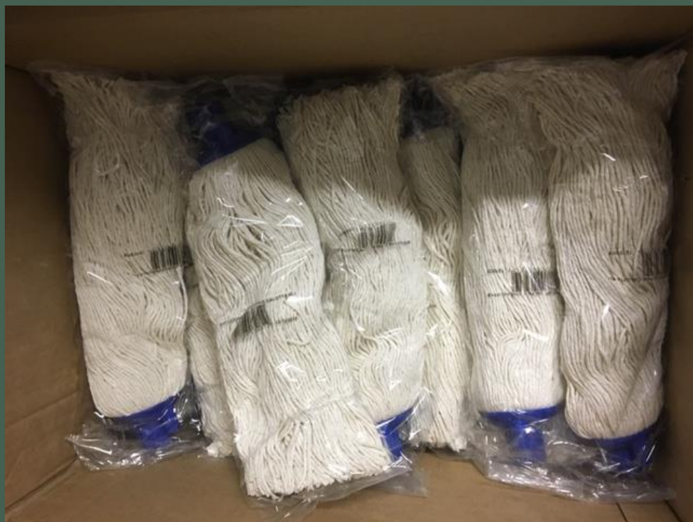
Mocio per pulire i pavimenti in cotone