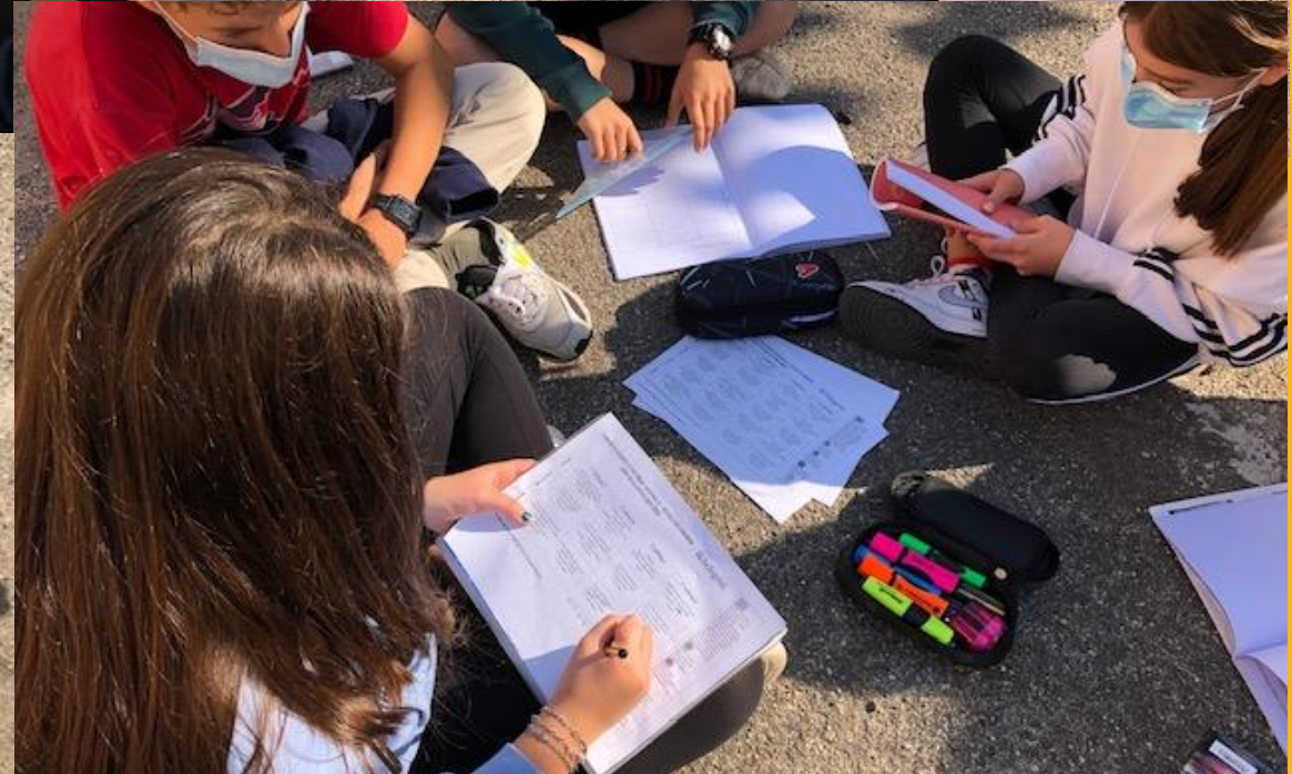
I ragazzi hanno lavorato in gruppo per pianificare il proprio menù