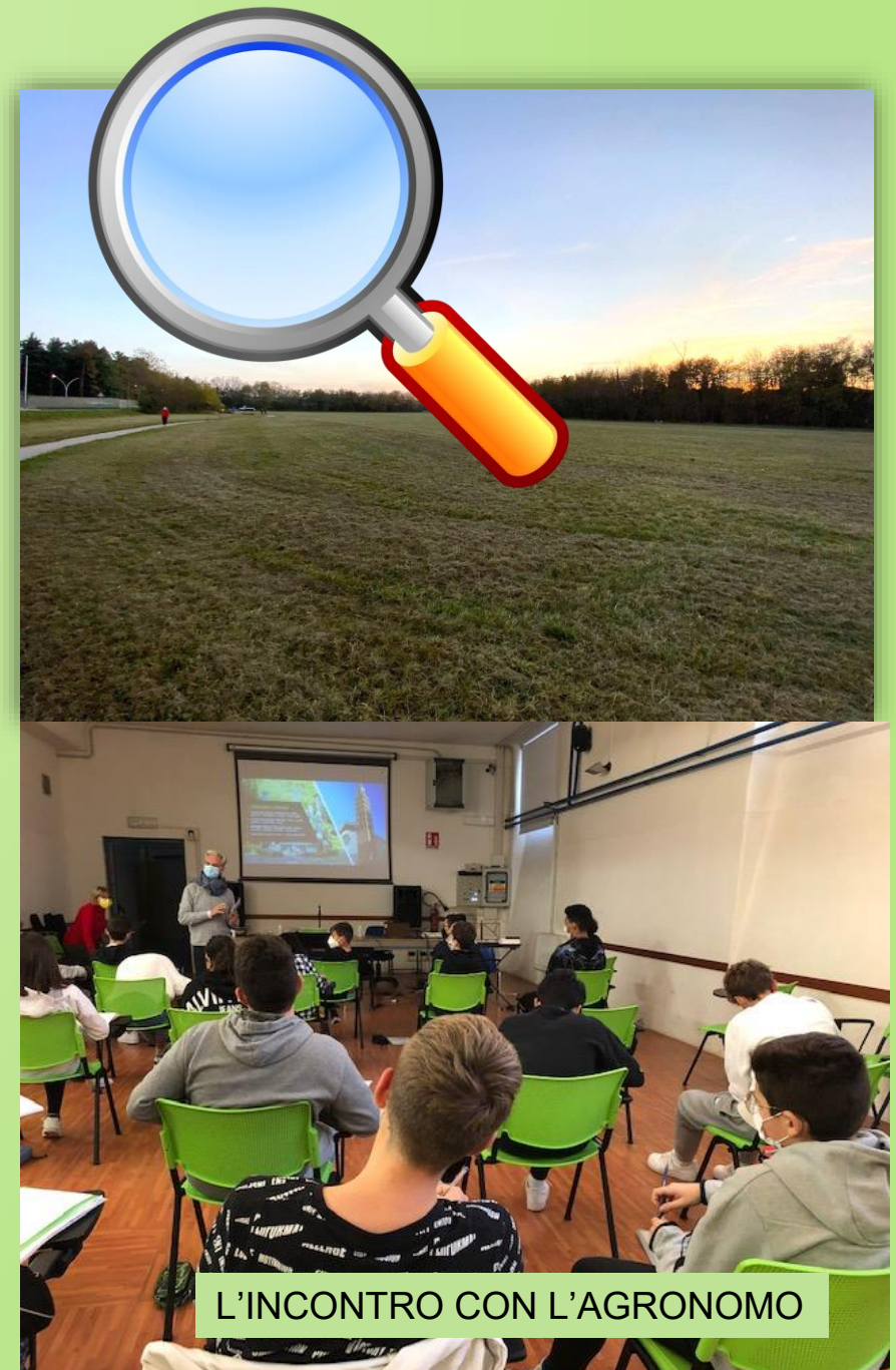
L'INCONTRO CON L'AGRONOMO

PER TALI RAGIONI VA CONSERVATO IL PIU' POSSIBILE INTATTO PER LA RICCHEZZA FAUNISTICA E FLORISTICA CHE LO CARATTERIZZA